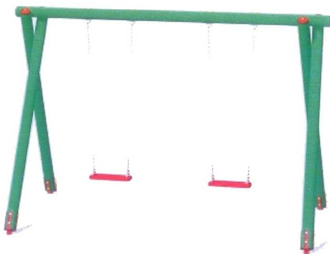
Widok z przodu